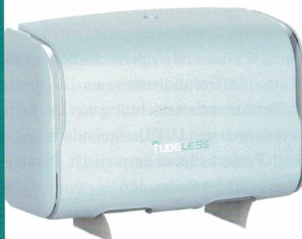
WC-Papierspender von Tubeless.