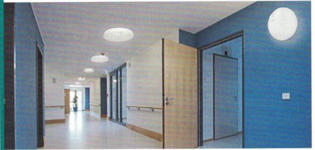
Blendarme Flurbeleuchtung von Regiolux.